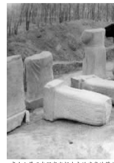
考古人员正在研究发掘出来的唐肃宗蕃酋像。

唐肃宗建陵首次发现蕃酋像和毛坯石人 建陵陵园平面形状大致呈长方形,陵墙依山势逶迤而行。建陵的陵园石刻,其艺术水平和工艺技巧代表了盛唐时期陵园石刻的最高水平。下宫(古时墓葬前的寝殿,供奉墓主灵魂,后人多于于此祭拜。)遗址位于南门口西南1.5千米处,破坏较为严重。