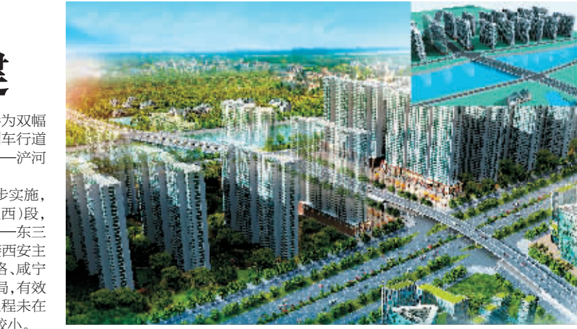
韩森东路“两桥一路”效果图

按照施工计划,本次工程将分三段同步实施,分别为:韩森东路(西十路—泾河西路以西)段、韩森东路—泾河桥工程段,韩森东路—东三环跨线桥工程段。项目建成后,将紧密连接西安主城区与泾渭生态区、灞河新区,形成长乐路、咸宁路、韩森东路并行直达主城区的新路网格局,有效提升西安东西方向交通能力。由于本次工程未在既有道路实施,施工期间对附近交通影响较小。