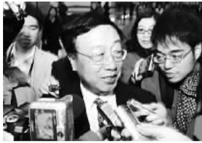
全国政协委员、中国证监会副主席范福春被记者包围。 上证

第三,意味着基础产业正面临严峻的挑战。当浮动薪酬越来越集中于少数行业、企业,当少数行业、企业的浮动收入增长越来越快的同时,基础行业收入水平增长缓慢甚至下降的矛盾日益突出。基础行业、企业收入增长缓慢,预示着收入分配的不公平、不合理正在严重制约甚至阻碍着基础产业的发展,工业等基础性产业面临前所未有的严峻考验。一方面,受利益驱动,基础产业的人才才会严重流失,一些有技能、有水平的人才流向浮动薪酬高的行业;另一方面,由于收入水平过低,基础产业职工的积极性、创造性会受到损伤,产业的发展前景堪忧。 霍浩俊