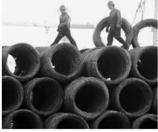
2008年2月22日,全球各主要钢铁厂商都已上调钢材价格,形成了全球钢材的普遍上涨。

据《第一财经日报》报道 经过不同利益部门的较量,印度财政部最终决定,2008年不加征印度铁矿石出口关税。