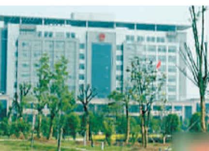
豪华办公楼和漂亮的花园。

只有200多名工作人员的河南省信阳市明港镇政府,却投资数千万元修建了一栋8000多平方米的豪华办公楼。