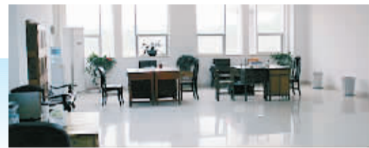
偌大的办公室空空荡荡。

一份信阳市发改委的批复显示,新办公楼项目设计批复为“总建筑面积控制在6464平方米以内,项目总投资控制在960万元内,资金来源为自筹”。